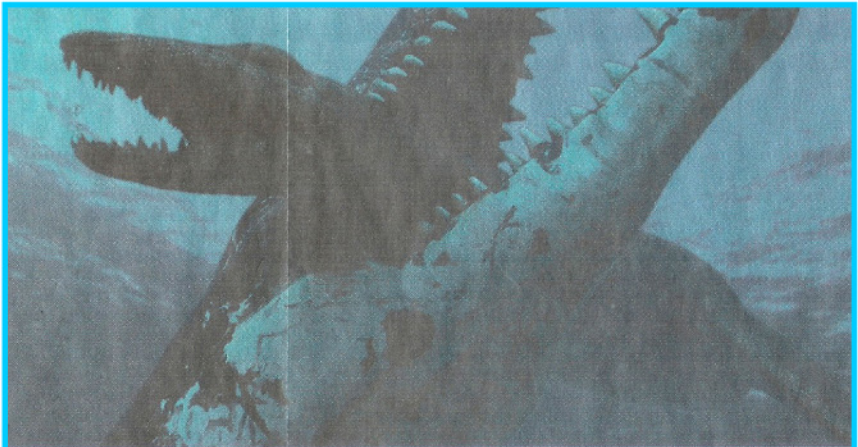
▲ En moderne computergengivelse af en pliosaurus' angreb på en mindre dinosaur. - Animation: Atlantic Productions/Universitetet i Oslo.