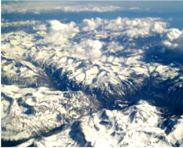
Snegrænsen er afgørende

Dette luftfoto over Sierra Nevada i USA viser, hvordan gletsjerne sænker landskabet ned til et bestemt niveau.